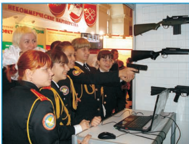
Изучение материальной части оружия и мер безопасности

Обучение первоначальным навыкам стрельбы